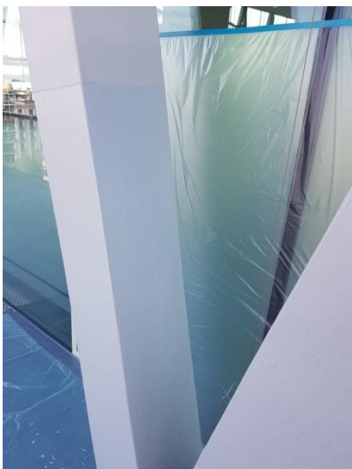
Brandschutz Sika Unitherm Platinum