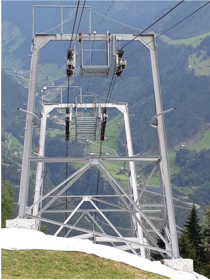
Masten 2 und 3; Sanierung 2018